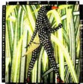
Boris Bućan: »Žar ptica«

Rašiću izložena u fascinantnoj vizualnoj prezentaciji, kakvu može potpisati i vrlo malo svjetskih muzeja.