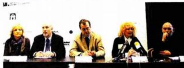
S predstavljanja nove izložbe u MUO