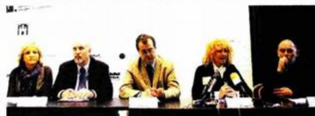
S predstavljanja nove izložbe u MUO