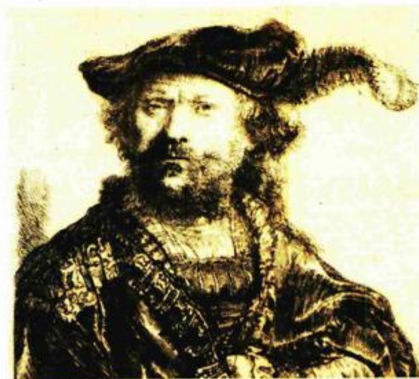
Rembrandt, Autoportet, 1638. godina

– Očekujemo ponajprije kulturološki uspjeh, ali ne zanemarujemo ni interes šire publike – kaže Miroslav Gašparović te dodaje da je nerealno očekivati da se ovakva izložba može približiti rezultatima nedavnih izložbi Chagalla (80.000 posjetitelja) ili Rembrandta (60.000). – "Vanjske" su izložbe obično posjećenije od naših domaćih, ali mislim da je 30 tisuća realno očekivati.