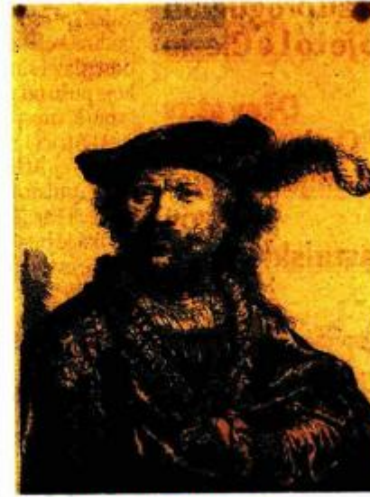
REMBRANDT VAN RIJN Autoportet, 1638. Nizozemski je majstor bakropisa bio jako iskren u svojim autopotetima, u kojima se prate sva njegova stanja, a poznato je kako je u životu imao niz uspona i padova, od slave do bankrota, od ljubavi do smrti svoje djece. Rad je poklon Ise Kršnjavog.