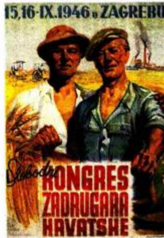
ANDRIJA MAUROVIĆ Kongres Zadrugara Hrvatske, 1946. U zbirci posjeduju najcjelovitiju zbirku strip crteža Andrije Maurovića, jednog od utemeljitelja tzv. autorskog stripa zagrebačke škole, sveukupno 500 Maurovićevih strip crteža nastalih u razdoblju od 1935. Tako se nalaze i neki plakati iz ranog razdoblja stvaralaštva.