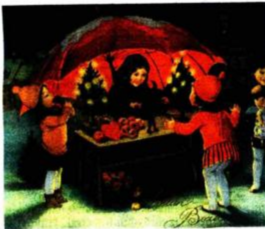
BOŽIĆNA ČESTITKA oko 1932. U zbirci se čuva sto pedeset tisuća razglednica različitih motiva, većinom hrvatskih gradova i mjesta, od onih najstarijih s kraja 19. stoljeća, do suvremenih. Također, svjedoči se o običajima vremena, kao što je na ovoj razglednici na kojoj djevojčice u centru Zagreba prodaju božićne ukrase.