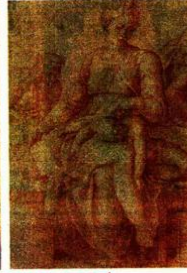
JULIJE KLOVIĆ Bogorodica s usnulim Isusom, 1540. Grafička zbirka NSK ima tri Klovićeva rada, dva crteža i jednu minijaturu, koju je Ured predsjednika RH poklonio prošle godine. Madonna del Silenzio, suptilan je crtež crvenom pisaljkom.