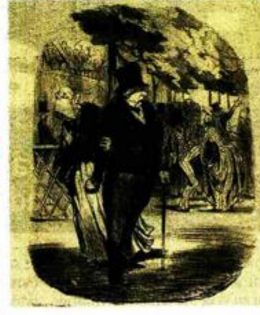
HONORE DAUMIER: Bez naslova, 1849. Grafike s britkim političkim komentarima ili provokativne satire francuskog društva u 19. stoljeću, kao što je slučaj s ovom grafikom bez naziva, tipične su za rad Honore Daumiera, koji je sjajno opažao ljudske nesavršenosti.