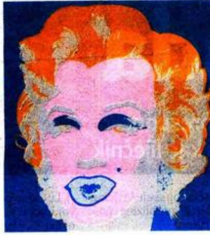
ANDY WARHOL Marilyn Monroe, 1970. Pop umjetnik upotrebom tiskarskih tehnika masovne kulture portetira slavne ličnosti. Među njima je najpoznatiji rad Marilyn Monroe. Warhol je poznat i po koketiranju s predmetima svakodnevnog potrošnje te po nizu provokativnih izjava.