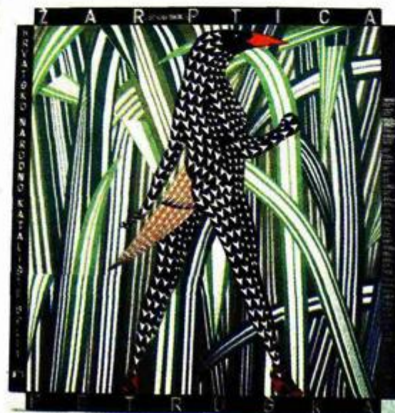
Poznate "Žar ptice" s plakata Borisa Bučana