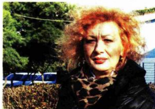
Ne samo da je u pitanju iznimno umjetničko blago stoljećima sakupljane građe, nego i njezina raznolikost

- Tako je. Istaknula bih djela Josipa Zankija i Igora Rončevića, umjetnika bogate karijere koji izvrsno promo-