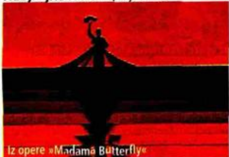
Iz opere »Madama Butterfly«

- Na prvo bih mjesto stavio Žmegačevu knjigu »Majstori europske glazbe« jer više nikad nećemo dobiti takvu knjigu. Na drugo mjesto svakako izravni prijenos ciklusa opera iz newyorškog Metropolitana u dvoranu »Vatroslav Lisinski« jer je to nemjerljiv globalizacijski pomak u distribuiranju umjetnosti.