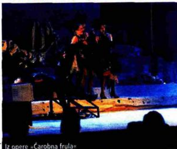
Iz opere »Čarobna frula«

- Uz otvorenje Muzeja suvremene umjetnosti, za kulturni događaj godine izdvojila bih predstavu »Zagrebački pentagram« ŽKM-a. Sama činjenica da se dogodio redatelj Paolo Magelli koji je okupio hrvatske pisce i od njih naručio tekstove, značajna je i svečana. Kao rezultat nastala je kvalitetna predstava u kojoj glumci briljiraju igrajući materijal koji je dio njihove/naše stvarnosti i podneblja, što je velik poticaj da se ta praksa angažiranja hrvatskih pisaca nastavi i dalje i u drugim hrvatskim kazalištima.