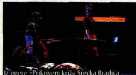
Iz opere »Prikriveni križ« Srećka Bradica

- Iako živimo u vremenu devalvacije interesa za kulturna, a pogotovo glazbena događanja, današnja hrvatska glazbena scena još je više ugrožena. Stoga svakako je hvale vrijedna realizacija opere Srećka Bradica »Prikriveni križ« na Muzičkom biennalu Zagreb. Izložba »Zagreb-München« ponovo nas je podsjetila na naše velikane s kraja 19. i početka 20. stoljeća. Oduševio me, također, Simfonijski orkestar Bavorskog radija.