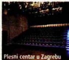
Plesni centar u Zagrebu

- Otvorenje Muzeja suvremene umjetnosti je ostvarenje jednog iznimnog napora i sna pojedinaca i grupa, generacija koje su težile za apsolutnom uključenosti u postavljanje, promišljanje i rješavanje pitanja koji stoje u korijenu svakoga radikalnog ispitivanja smisla, i to u trenutku kada se takav duh brusi, oblikuje i na kraju vlada u svjetskim žarištima. Otvorenje Plesnog centra, skromnije po veličini uložena, pandan je otvaranju Muzeja suvremene umjetnosti, jer okuplja i daje mogućnost razvoja ozbiljnom kreativnom potencijalu hrvatskih koreografa i plesača. Gostovanje orkestra Concertgebouw iz Amsterdama - glazbena vrijednost takova događaja ne iscrpljuje se u trenutku izvedbe, trajanju doživljaja, niti je samo obogaćenje kulturnog života i dokaz osjetljivosti sredine za prave vrijednosti.