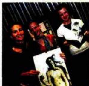
Ekipa Festivala novog cirkusa

- Festival novog cirkusa izabirem kao najvažniji kulturni događaj, zato što pokazuje ono što je u umjetnosti najvažnije - snagu kreativnosti. Riječ je o festivalu što je nastao zalaganjem male grupe entuzijasta koji u skučenim produkcijskim i financijskim uvjetima rade visoko profesionalni posao. Tema žene u cirkusu, koju su pratile i teorijske rasprave, smatram pravim izborom: pokazati ono što je doista novo u umjetnosti.