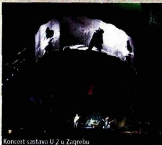
Koncert sastava U 2 u Zagrebu

- Na prvo mjesto kulturnih događaja izdvojio bih otvorenje Muzeja suvremene umjetnosti, događaj koji smo dugo s nestrpljenjem iščekivali. Jednako bitnim smatram i otvorenje muzeja u drugim krajevima Hrvatske (Muzej antičkoga stakla u Zadru i Galerije umjetnina u Splitu). Svakako je veliki glazbeni događaj kad nam u gostovanje dođu dva vrhunska inozemna orkestra s Hardingom (Orkestar Concertgebouw) i Jansonsom (Simfonijski orkestar Bavorskoga radija) i taj prijedlog bih uvrstio na drugo mjesto, koje bih podijelio sa zadnjim koncertom preminuloga Vjekoslava Suteja s Tomislavom Mužekom i Simfonijskim orkestrom HRT u Dvorani Lisinski, koji će za mnoge njegove poštovatelje ostati u trajnom sjećanju. Kao treći prijedlog na području pop glazbe izdvojio bih gostovanje grupe U2 na Maksimiru.