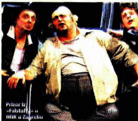
Prizor iz »Falstaffa« u HNK u Zagrebu

- Među brojnim kulturnim događajima koji su obilježili proteklu godinu svakako bih izdvojio otvaranje Muzeja suvremene umjetnosti, zaista kapitalnog djela naše kulture i ostvarenje trajne vrijednosti. Od događaja iz likovne umjetnosti treba izdvojiti i izložbu Zagreb-München u Umjetničkom paviljonu, zatim izložbu Alfreda Pala u Muzeja za umjetnost i obrt »Slavonija« u Klovićevim dvorima. Na polju glazbene umjetnosti svakako treba izdvojiti koncerte Višnje Mažuran, zatim nastupe ansambla Cantus te izvedbu Verdijeva »Falstaffa« u HNK. Što se književnosti tiče, konkretno proze, moram spomenuti nova prozna djela Julijane Matanović, Miljenka Jergovića, Ede Popovića i Zorana Kravara.