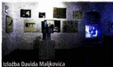
Izložba Davida Maljkovića

- Vrlo važan događaj koji je kod nas ostao posve nezabilježen je niz svjetskih uspjeha Davida Maljkovića - od samostalnih izložbi u više uglednih muzeja i galerija, do uključivanja njegovih radova u Tate Modern, koji je sada (uz njujoršku MOMA-u, Centar Georges Pompidou i Van Abbemuseum) još jedan od vodećih muzeja koji u zbirci ima Maljkovićeve radove. Također, angažirana i promišljena serija akcija Igora Grubića te izložba u Galeriji Miroslav Kraljević i knjiga koje su okupile dokumentaciju o njegovih »366 rituala oslobađanja«.