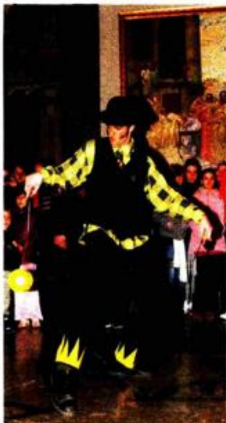
Žongliranje u Umjetničkom paviljonu

U cijeloj Hrvatskoj je tijekom te noći muzeje razgledalo čak 278.000 ljudi, a njih 160.000 samo u Zagrebu. Rekorder je Muzej suvremene umjetnosti - 33.000 posjetitelja