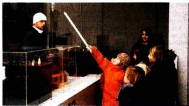
Muzeji su privukli i mladu publiku