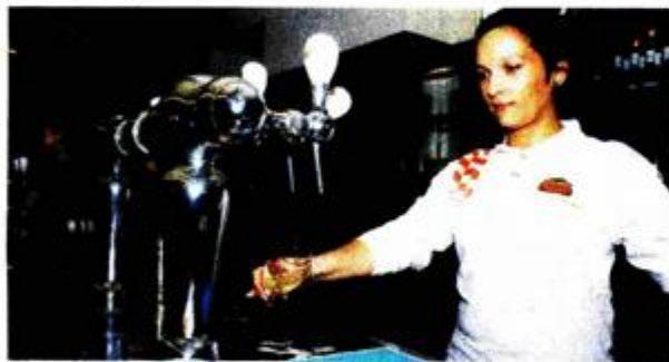
Promocija piva u Zagrebačkoj pivovari