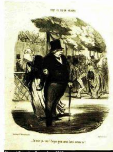
Honoré Daumier, Bez naslova , 1849.

Slijedi hodnik u kojemu su prikazane stare razglednice, nerijetko jedini pokazatelj povjesničarima i restauratorima kako je nešto izgledalo, a nakon toga ulazi se u prostoriju posvećenu jednom od najinventivnijih hrvatskih grafičara – Miroslavu Šuteju. Njegov ludizam uvijek je popraćen lucidnim rješenjima i u tome je on doista nenadmašan. Svojevrsna izložba u izložbi dolazi kao osvježanje