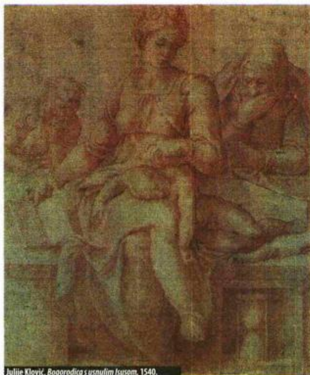
Julije Klović, Bogorodica s usnulim Isusom , 1540.