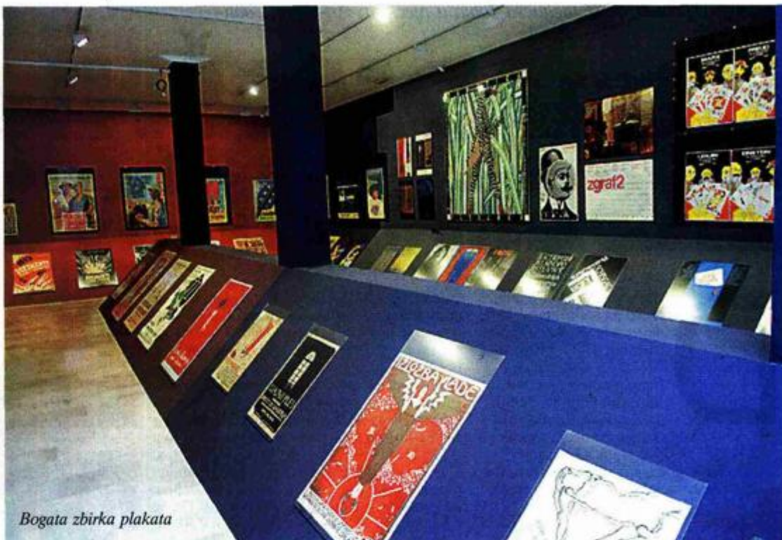
Bogata zbirka plakata

U zagrebačkom Muzeju za umjetnost i obrt do 31. siječnja otvorena je izložba »Od Klovića i Rembrandta do Warhola i Picelja«