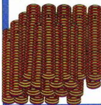
MIROSLAV ŠUTEJ "Mobilne grafike" 1973. godine