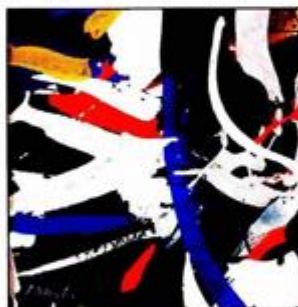
GRAFIKA EDE MURTIĆA "Kompozicija" 1977. iz Grafičke zbirke NSK

Dva od tri Klovićeva djela su otkupljena, a jedno djelo je hrvatski predsjednik Stjepan Mešić odlučio donirati u zbirku NSK. Time je Zbirka bitno obogaćena crtežima jednog od najvećih hrvatskih likovnih umjetnika i svjetski poznatog majstora crteža, toga, kako ga rado nazivaju, "Michelangela minijature", rekao je Gašparović.