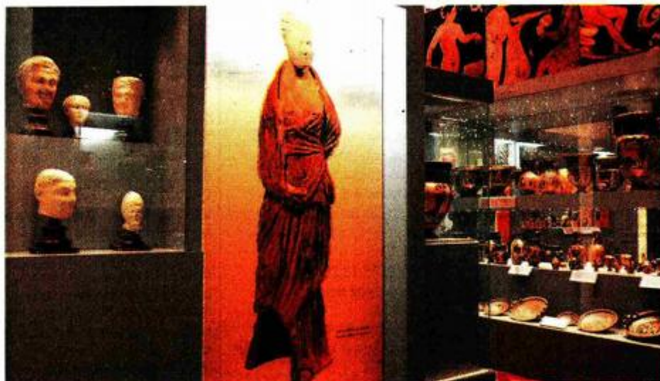
Arheološki muzej: Antička zbirka sadrži otprilike 40.000 spomenika iz doba stare Grčke i Rima

Matoševa 9, tel: 48 51 900 , otvoren od ponedjeljka do petka od 10 do 18 sati te subotom i nedjeljom od 10 do