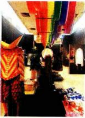
Etnografski muzej: Moć boja, kako su boje osvojile svijet

Tomislavov trg 22, tel: 48 76 487, 48 41 070 , otvoren od ponedjeljka do subote od 11 do 19 sati, a nedjeljom od 10 do 13 sati. Ulaznice 30 kuna, za dake, studente, umirovljenike i grupe 15 kuna, a ponedjeljkom je ulaz besplatan. Besplatna vodstva za posjetitelje vikendom subotom u 11.15, 12.30 i 17 sati, a nedjeljom u 11.30 sati. Na izložbi Zagreb - München: Hrvatsko slikarstvo i akademija likovnih umjetnosti u Münchenu mogu se razgledati 93 djela hrvatskih slikara upisanih na Akademiju likovnih umjetnosti u Münchenu od 1870. do 1920. godine: Izidora Kršnjavog, Ferdinanda Quiquereza, Josipa Bauera, Nikole Mašića, Antona Arona, Dragana Melkusa, Gustava Poša, Huga Lukšića, Marka Murata, Mate Celestina Medovića, Mencija Clementa Crnčića, Bele Čikoša Sesije, Otona Ivekovića, Ivana Tišova, Roberta Auera, Oskara Hermana, Josipa Račića, Vladimira Becića, Miroslava Kraljevića, Ljube Babića te njihovih münchenskih profesora. Izložba je otvorena do 31. siječnja.