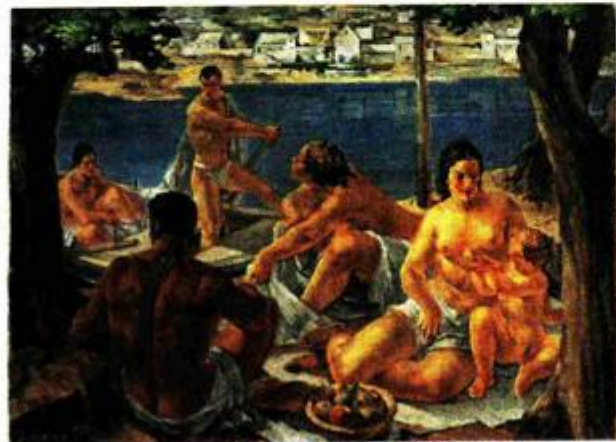
Jozo Kljaković: Odmaranje na plaži, ulje na platnu naslikano 1928.

Opatička 20, tel: 48 51 361 , otvoren utorkom, srijedom i petkom od 10 do 18 sati, četvrtkom od 10 do 22 sata, subotom od 11 do 19, nedjeljom od 10 do 14 sati, na Badnjak i Staru godinu od 10 do 15 sati.