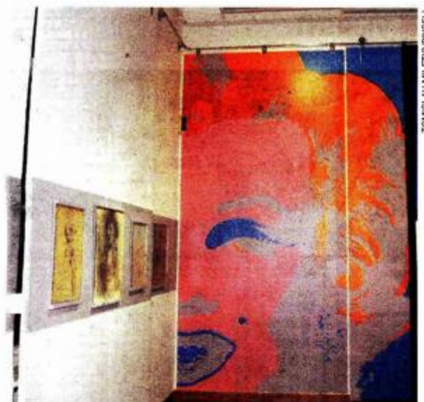
700 djela hrvatskih i stranih umjetnika od XVI. do XX. stoljeća