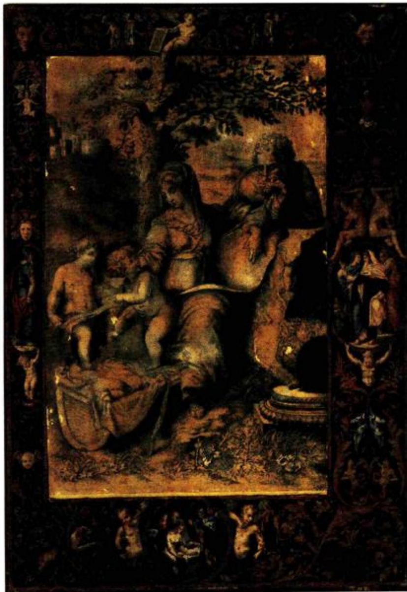
Julije Klović, Ukrasni okvir za crtež sv. Obitelj ispod hrasta , oko 1530.

Muzej za umjetnost i obrt, Zagreb, 8. prosinca 2009. - 31. siječnja 2010.