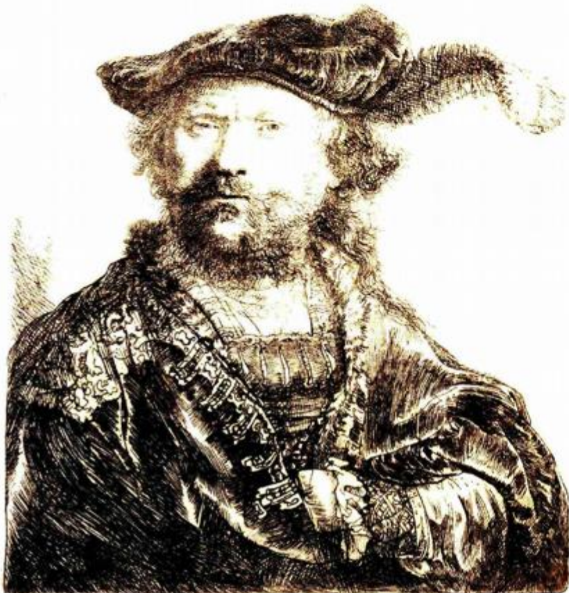
Najpoznatija grafička mapa nastala izvan Hrvatske, a koja se također nalazi u zbirci, jest mapa "Mavena" koju potpisuju Joan Miro' i Radovan Ivšić. desno: Rembrandt Harmenszoon van Rijn, Autoportret , 1638.

Tu su i brojni ex librisi među kojima se posebno izdvajaju svojom vrijednošću oni iz zbirke Emila Laszowskog. Razglednice koje su također dio izložbe, nalaze se u zbirci koja sadrži više od sto tisuća primjeraka, uglavnom nastalih na prijelazu iz devetnaestog u dvadeseto stoljeće. Grafička zbirka osnovana je još 1919. godine kao dio Sveučilišne knjižnice, a među njezinim osnivačima bili su i glasoviti umjetnici Ljubo Babić, Tomislav Krizman i Menci Clement Crnčić. Šezdesetih godina Zbirka se proširila na plakate, ex librise, razglednice i ovitke knjiga.