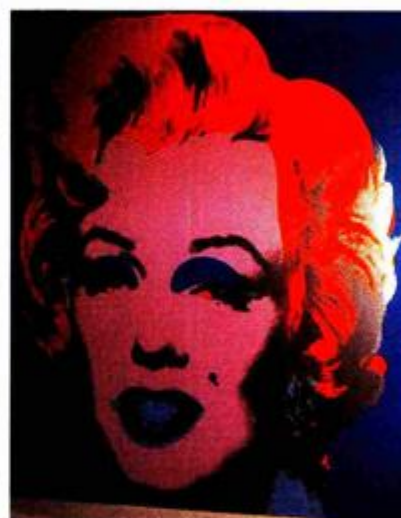
Andy Warhol, Marilyn Monroe, 1967.