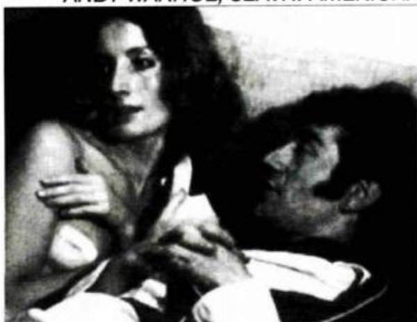
"Loves of Ondine"