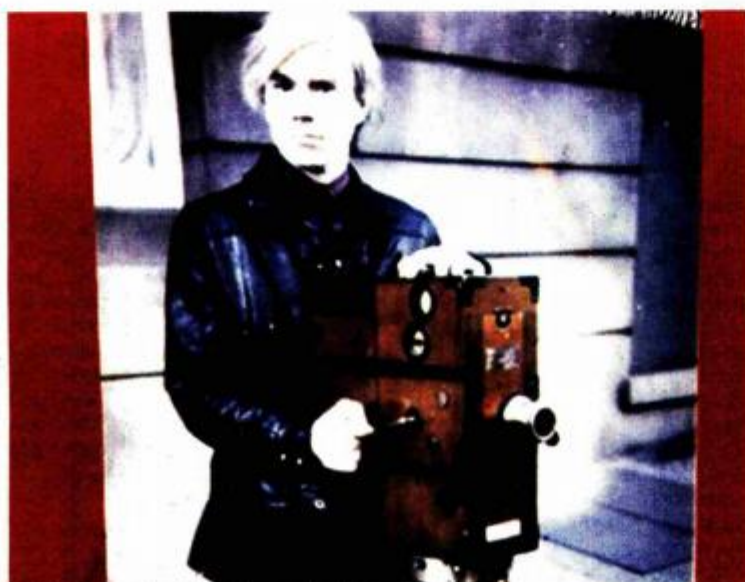
Ako je njegovim filmovima nedostajalo drame, životu svakako nije - Andy Warhol

Kad se Warhol latio filma, već je bio razvikana primadona pop-arta. Marilyn Monroe, limenke Campbellovih juha, dramatične slike smrti u prometnim nesrećama ili električnim stolicama, uzbuđile su i zaprepastile javnost. Pristupio je filmu prvenstveno kao kameri i vrpici, nikako s umjetničkim nadahnućem (nadahnuće je posve odbacivao) ili pristajanjem uz bilo kakvu filmsku tradiciju, komercijalnu akademsku ili avangardnu. Naravno imao je iskustva iz kinodvorana, ali je u vlastitom stvaralaštvu ta iskustva nijekao, zanemarivao i totalno odbacivao. Warholovo bavljenje filmom trajalo je prilično kratko i obuhvaća razdoblje od 1963. do 1968. U početku je stvarao nijeme crno-bijele filmove, s kamerom Bolex u jednom kadru, do kraja statično, pod istim kutom, bez montaže i koliko se god moglo, u skladu