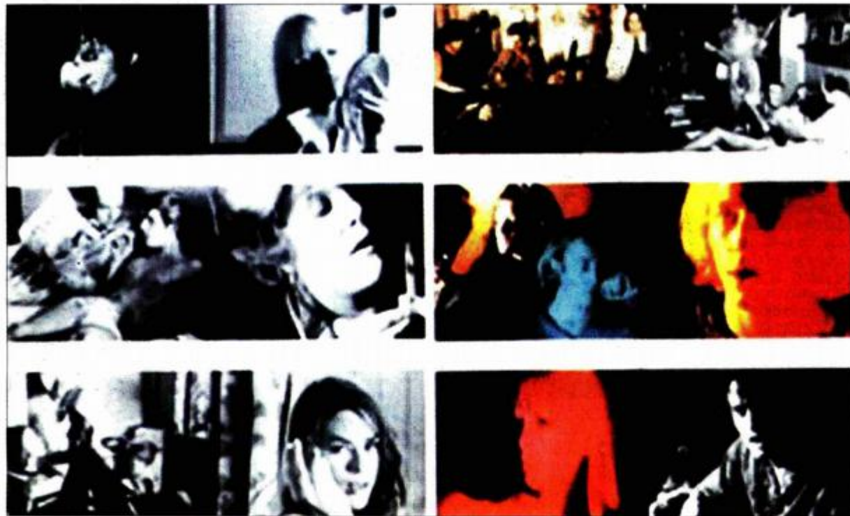
"The Chelsea Girls"

s tehničkim uvjetima, produčenom trajanju. Da je mogao, Warhol bi snimak odveo u beskraj.