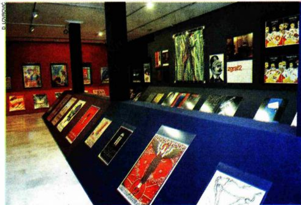
Plakati suvremenih hrvatskih grafičara - dio izložbe

- Ovo je svečanost umjetnosti i umijeća jer kod grafike nije bitna samo trenutna inspiracija umjetnika, nego i umijeće majstora, kazao je ministar kulture